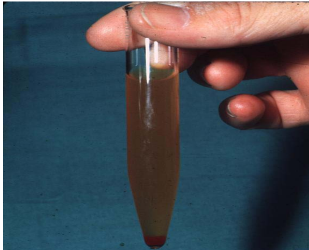
جوولانی ئه و به ردانه ده بیته هۆی داپووشانی ناو پۆشی (دیوار). ئه و ئه ندامانه وه له ئاکام دا خوین دهرژیتیه ناو میزو سووری ده کا.

۱- هه بوونی به رد (Ston) له گورچیله، لوله ی میز، میزه لدان، چووک،