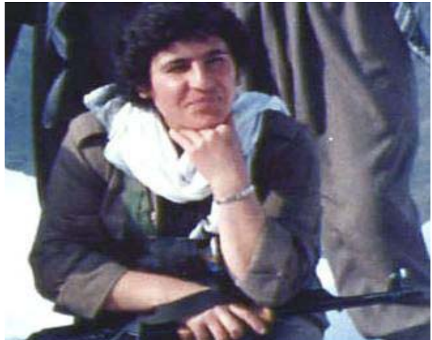
شەهید پەروین رووحی

دەق وایە و لە کوێ دیتراوە کە زۆرداران و داگیرکەران دەستی کەرەمیان وەپێش خستبێ و حەقی ژێردەستان و ماف خوراوانیان دابین کردبێ یا نا؟! و چیدیگە درێژەیان بەو زۆر زۆرداریانە نەدابێ. بە لکۆو رابوون و وەخۆهاتنی مرۆفشی گەلانی ژێردەستە بۆ وەدەستەهێنانی مافی زەوتکراویان و رزگار بوونیان لە دەست کۆیلەتی و دیکتاتۆری و خۆدیتنەوهیان لەناو کۆمەلگە بەشەرییەت دا و دەبینی ئەو حەقە کە بە دواي دا دەچێ دەبێ بەهای خۆشی بۆ دابین بکری و ئەستاندنی ئەو حەقە جۆگەلە خۆینی مرۆفشی دەوی بۆ دەستەبەرکردنی ئازادی بەشەرییەت و رزگاری گەلانی ژێردەستە، کە واتە گەلی کورد بە درێژایی میژووی بەشەرییەت بە دەست داگیرکەران و زالمانی خۆینرێژەر چەوساوەتەوه و غەدری لێکراوە و شارو گوندیان وێران کراوە و مرۆفەکانی بە کۆمەل ژێرخاک کراون و تەنانەت رووح بە ئازەلێشیان نەکراوە و کانیاوەکانی ئاوی ئەو ولاتە کە سروشتی جوانی ئەو ولاتەیان رازاندۆتەوه دەستی جینایەتیان گەیشتۆت و بە سیمانکاری پەر کراونتەوه و سروشتی ئەو ولاتە جوانەیان سپیووتەوه و دارو رەزو باغ و گیاو گۆل و گیانلەبەرە کێویبەکانیشیان قەر کردووە.