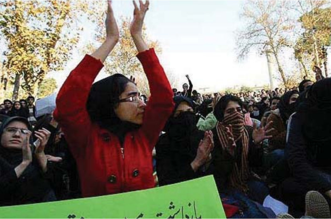
كۆنەپەرستان دانەنەواندووه ريگه نادەن كۆمەلگە ئاخوندى كۆنەپەرست و دواكەوتوو، ئەوان بېگنەنەو بۇ سەدەكانى جاھيلەيت .