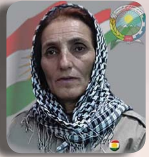
نامینه نهحمه دزاده

نهو دایکانه ی نهوه یه کی راست و دروست په روه رده ده کهن تا دواروژتیکی باش بو ولاتمان دابین بکهین