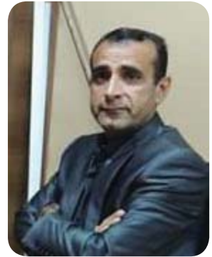
دیدەوان یه عقوب

، به لām وهک ریزیک له دوونای مئ و نیردا هه میشه کورد ناوی مئی پیشخستوو وهک لیڤه دهیان خهینه پوو .