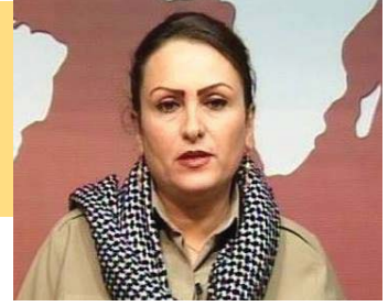
سەرچاوه: ئىنتېرنېت وهرگيران: داىكى كيان

ئەو بۇيى نىيە ناپەزايەتى دەربېرى. ريگەچارە دىكەش ھەيەو زۆرىش ئاسانترە، دەتوانى لە مالەوھە بىمىنئەتەوھە مالدارى بكا! بەلام ئىستا کہ بۇخۇي قىبوولى کردوھ، ئىستا کہ نايەھوئى پروانامەكەي لە سەر تاقە بىمىنئەتەوھە تۆزى لى بنىشى، ئىستا کہ پىيى خۇشە لەناو كۆمەلگا دابى و خوازىارى ئەوھەيە کہ سەر بەخۇيى ئابوورى ھەبى، نابى لە مالدارى دا کہ مترخەم بى و پىويستە كارو بارى مال و منالەكانىشى بە باشى بەرپۆھ ببا، ئەگىنا ھەمان ئاش و ھەمان كاسەيە، مەچۆ سەر كار! چ پىويستىيەكت بەم برە پارەيە ھەيە، لە مالى بىمىنەوھە خانم و خاتوونى خۆت بە. ئەوانە گۆشەيەك لەم گرفتانەن کہ بەشىكى زۆر لە ژاننى فەرمانبەر لەگەلىان رووبەرپوو دەبنەوھە.