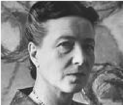
سیمون دوبووار فیمینیستی به ناوبانگی فهرانسه وی