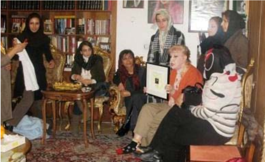
سیمین بیټبه هانی: من قه دهمم خیر بوو، توانیم به بی دودی سهری برؤم و خه لاته که تان بو پینتمه!

رایوړتنووسانی بی سنوور و ئه م خه لاته تازه یه ش بو که مپه یینی یه ک ملیون ئیمزا له گه ل ئه وهی سهرکه وتن و سهریه رزیبه بو بزووتنه وهی یه کسانیکه خوازی له ئیراندا له چنه د باریکیشه وه جیکای سهرنج و تیرامانه.