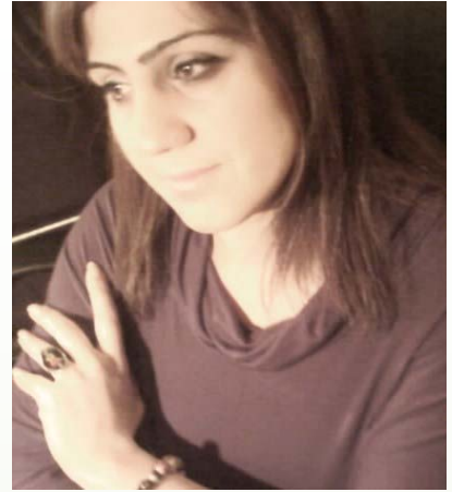
کوستان عومه رزاده

له کانیاوی به خته وه ریت ده خومه وه له نامیزی شهوتا شوشه خالیه کانی ته مهن پرپرده که م له بونی عه ترو چاوی خه والوی به بانیمان له ناوتته بووندا مه ست ده که م